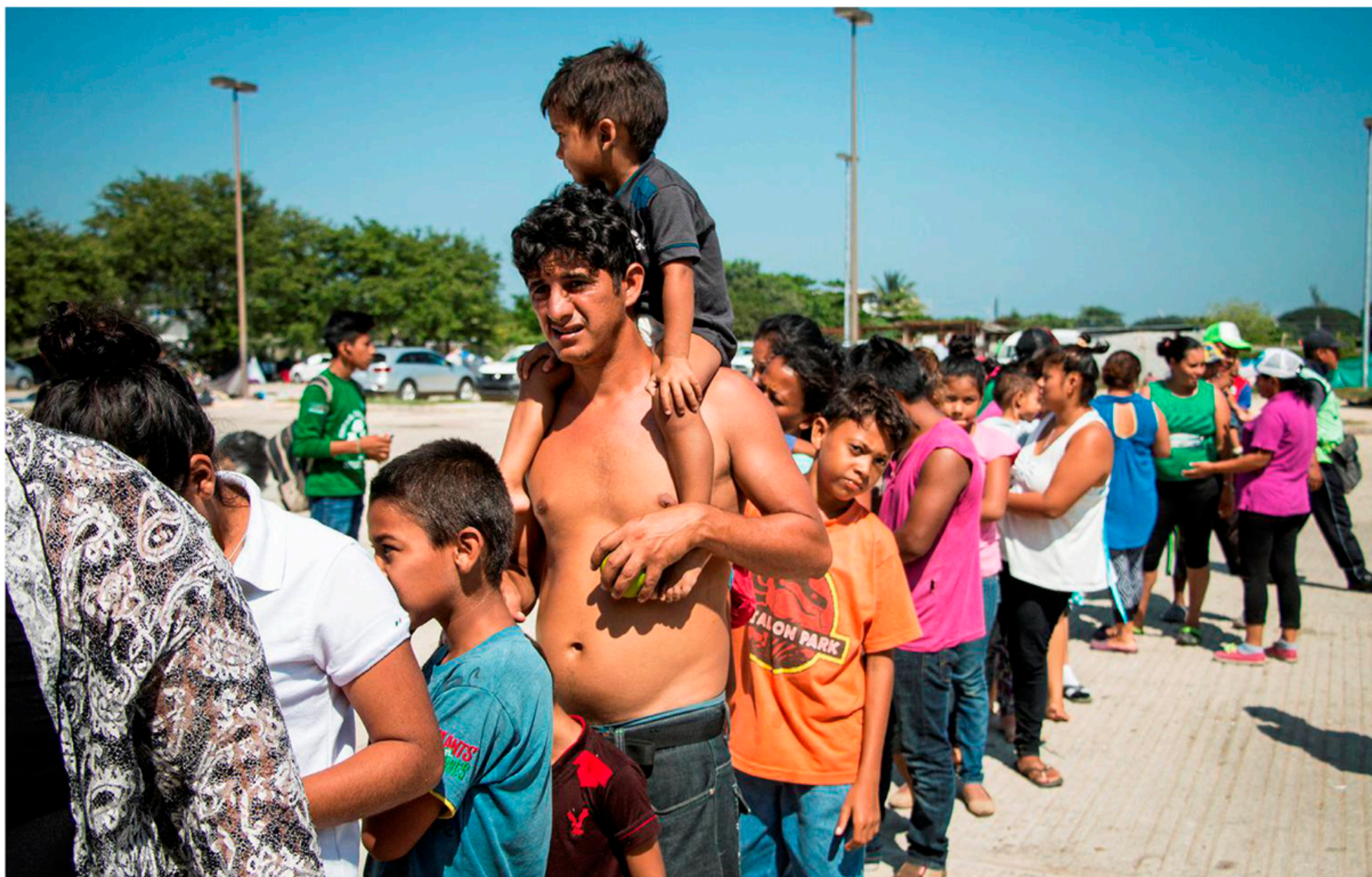
PAUS PÅ VÄGEN. Migranter köar för att få tvål på det tillfälliga härbärget i Juchitán i södra Mexiko.